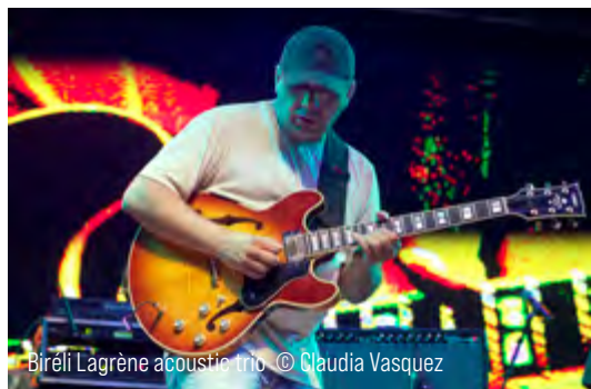
Biréli Lagrène acoustic trio