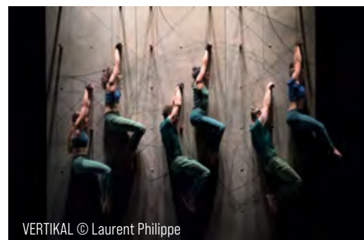
VERTIKAL