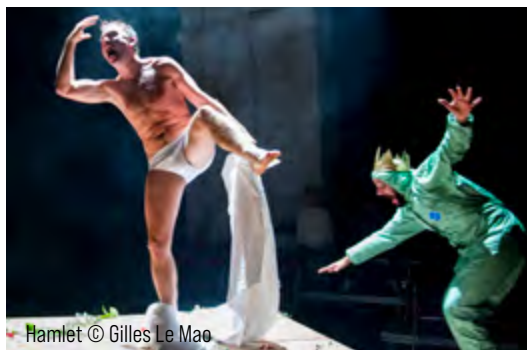
Hamlet © Gilles Le Mao